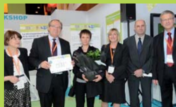
Le CHU de Bordeaux et le centre SSR Les Embruns ont reçu un Award DDH