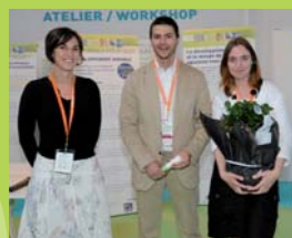
La maison de retraite des Fromentaux et le centre de dialyse du Béarn ont eux aussi été primés.